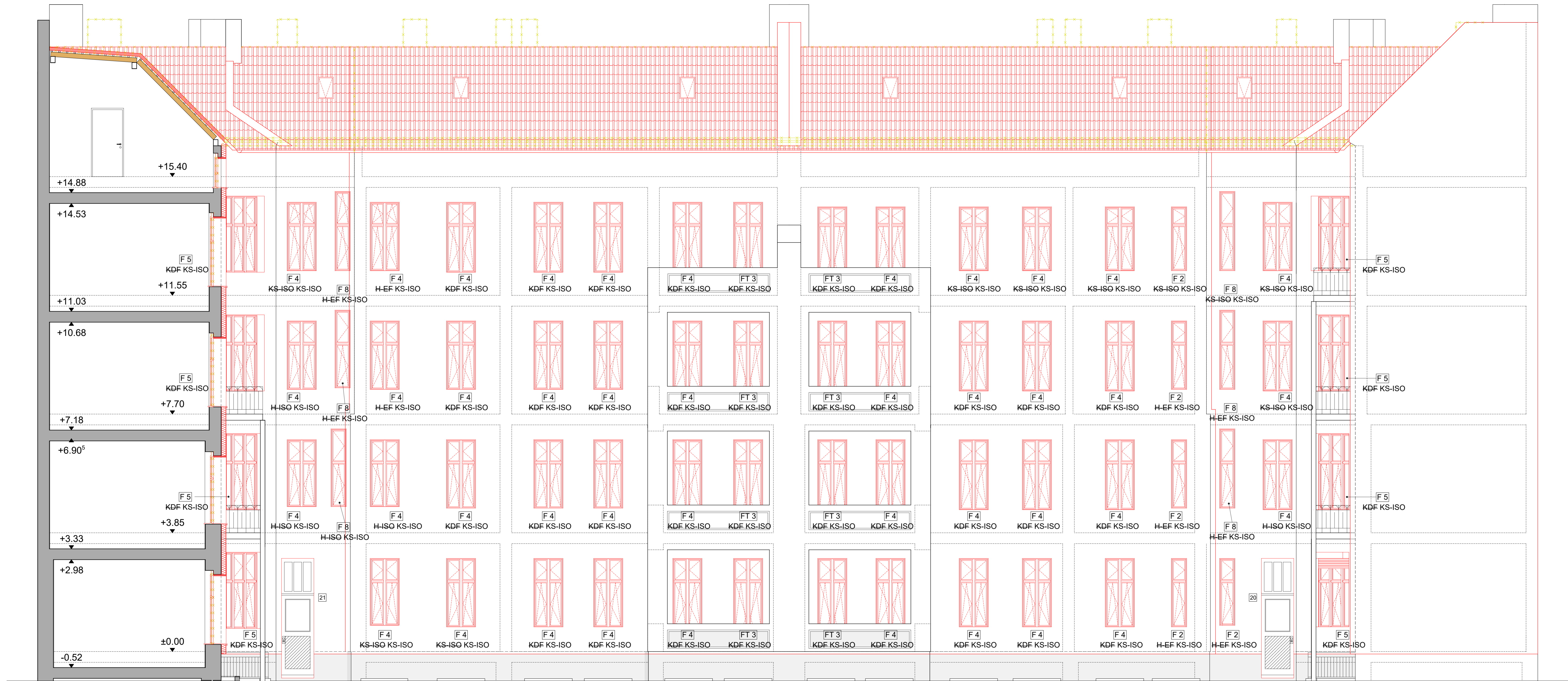
Ansicht Ost Stierstraße 20, 21 (Gartenhaus)